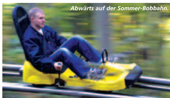
Abwärts auf der Sommer-Bobbahn.