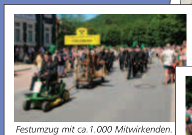
Festumzug mit ca. 1.000 Mitwirkenden.

Zum Programm gehören u. a. die Wahl der Harzfestkönigin, die Harzer Waldarbeiter-Meisterschaften, das Harzkönig-Schießen der Schützenvereine. Höhepunkt wird der Festumzug mit über 1.000 Beteiligten.