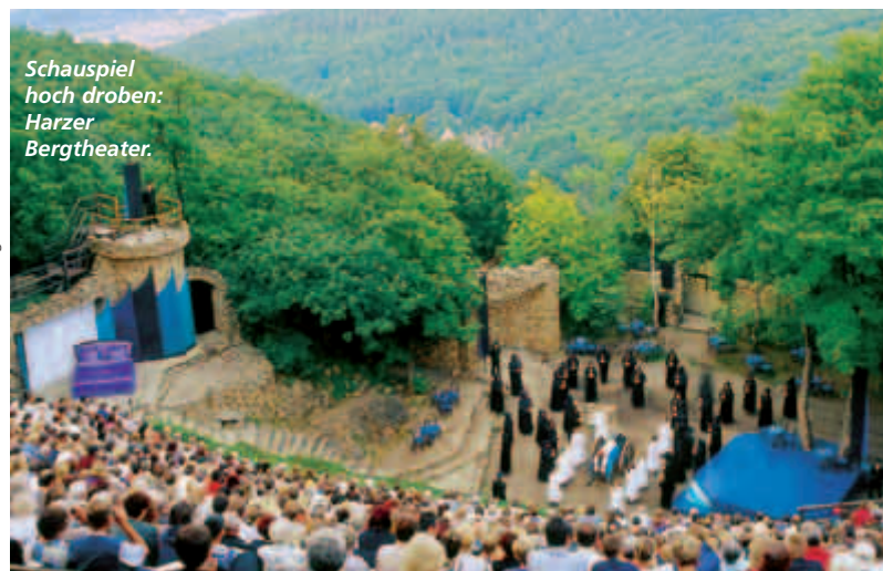
Schauspiel hoch oben: Harzer Bergtheater.

tanzplatz an. Möglich ist auch eine arrangierte dreitägige Rundwanderung mit Hexentanzplatz, Bodetal und Rosstrappe.