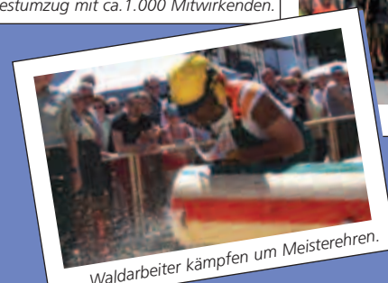
Waldarbeiter kämpfen um Meisterehren.