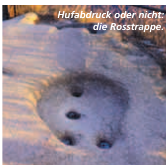
Hufabdruck oder nicht: die Rosstrappe.

■ Als kurze Ausflüge bieten sich der Aufstieg zur Rosstrappe oder zum Hexen-