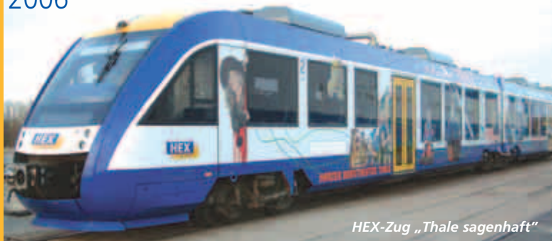
HEX-Zug „Thale sagenhaft“