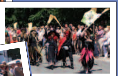
Harzhexen im Festumzug.