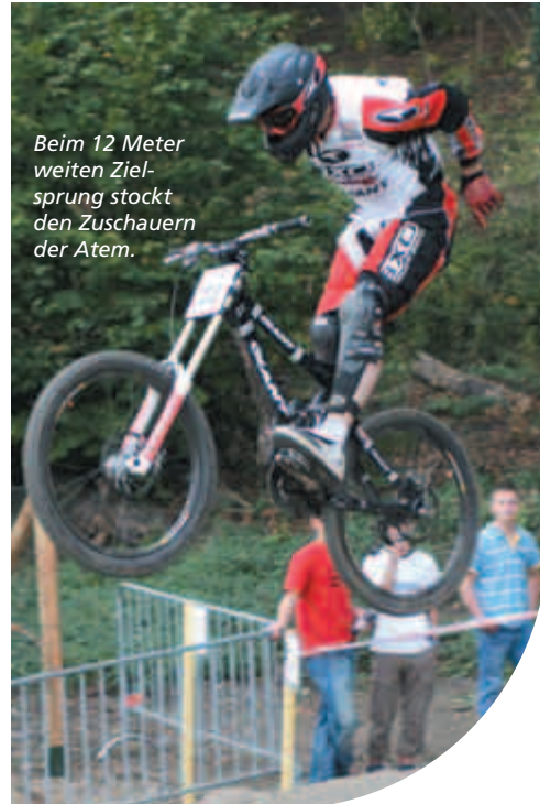
Beim 12 Meter weiten Zielsprung stockt den Zuschauern der Atem.