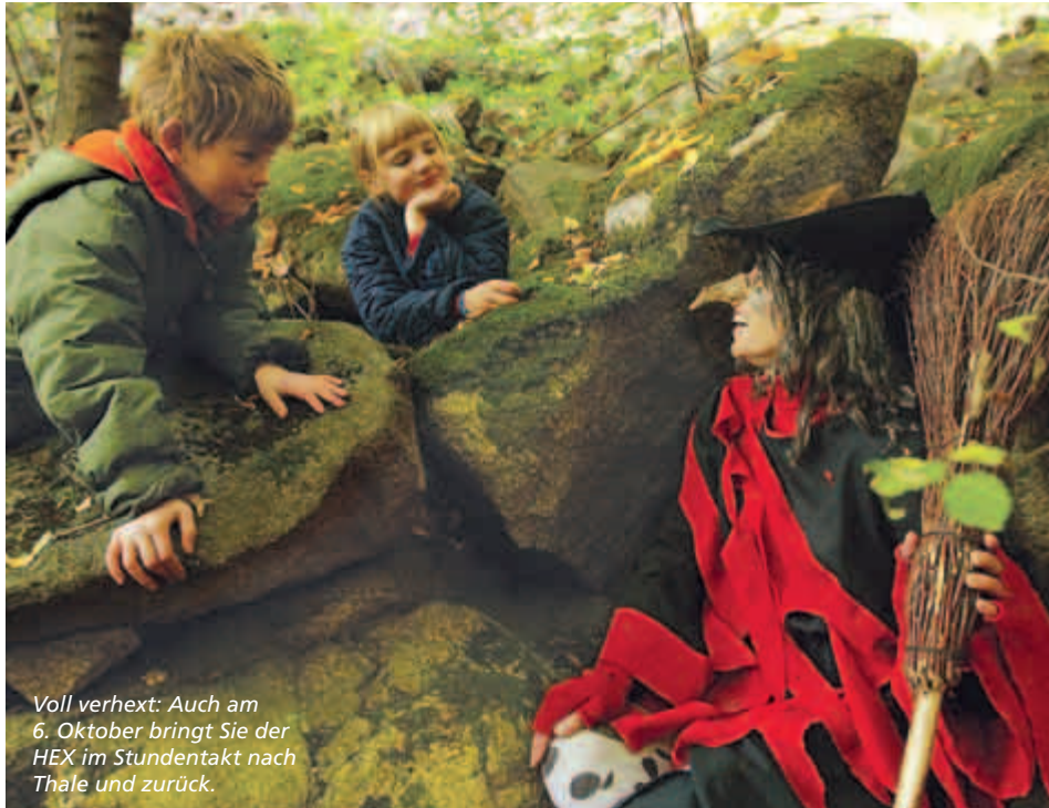
Voll verhext: Auch am 6. Oktober bringt Sie der HEX im Stundentakt nach Thale und zurück.