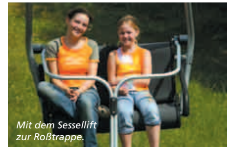
Mit dem Sessellift zur Roßtrappe.

Ein ganz besonderes Erlebnis ist außerdem der Tagesausflug ins „Hexenparadies“ Thale – dank Kombiticket der Seilbahnen Thale Erlebniswelt und des Harz-Berlin-Express! Der startet wieder samstags und sonntags um 7.10 Uhr ab Berlin-Ostbahnhof. Ab Halberstadt erfolgt eine Zugteilung: Ein Zug fährt nach Wernigerode, der andere nach Thale (Ankunft 10.41 Uhr).