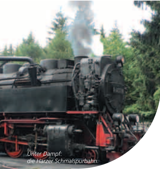
Unter Dampf: die Harzer Schmalspurbahn.