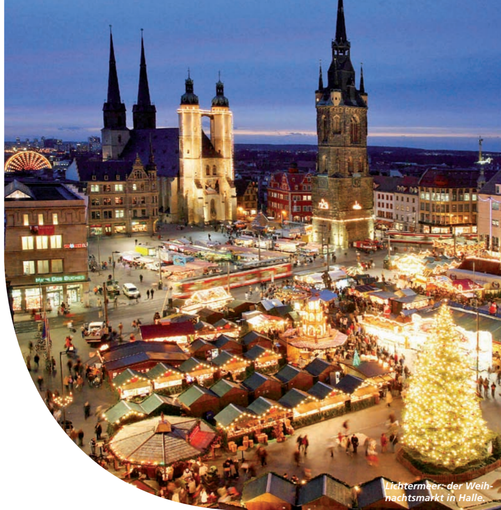
Lichtmeer der Weihnachtsmarkt in Halle.