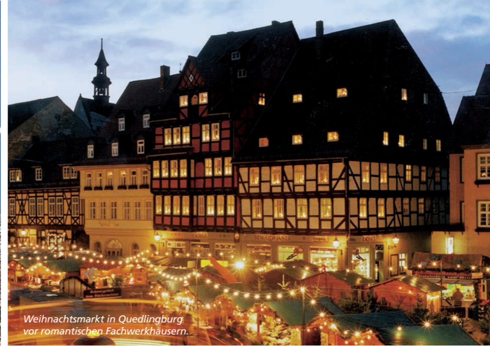
Weihnachtsmarkt in Quedlinburg vor romantischen Fachwerkhäusern.