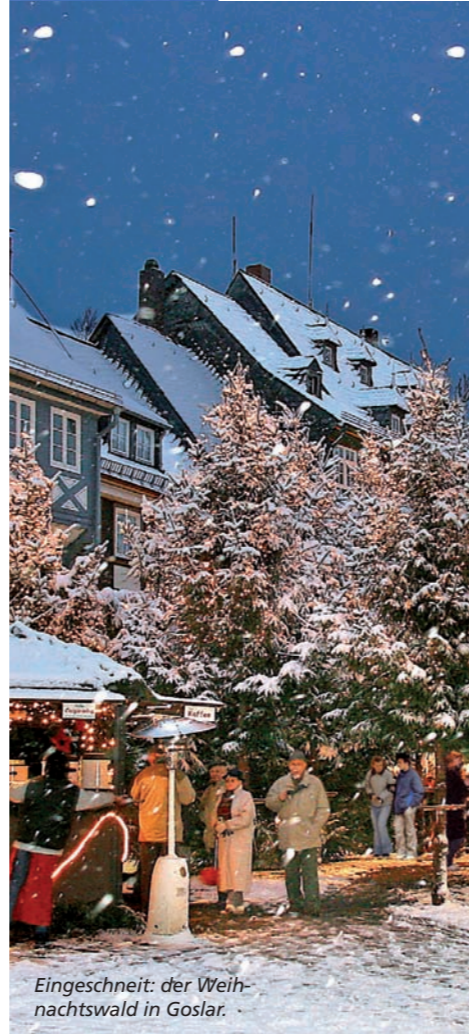
Eingeschnitten der Weihnachtswald in Goslar.