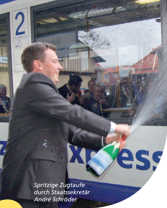
Spritzige Zugtaufe durch Staatssekretär André Schröder