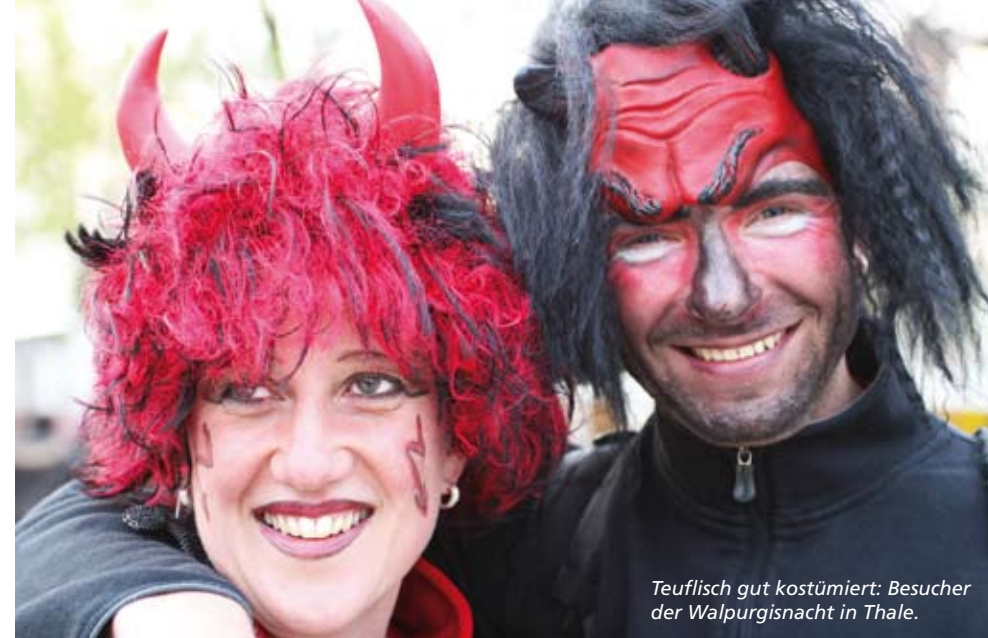
Teuflich gut kostümiert: Besucher der Walpurgisnacht in Thale.

Diesen Termin sollten Sie sich schon einmal vormerken: Vom 12. bis 14. Juni findet in Thale der 13. Sachsen-Anhalt-Tag statt! Zum Landesfest werden rund 200.000 Besucher erwartet. In das dreitägige Fest integriert sind auch die Harzer-Sommertage. Das weitläufige Festgebiet wird 19 Bühnen, 5 Regionaldörfer und 7 Themenstraßen umfassen. Am Sonntag, dem 14. Juni 2009, wird ein großer Festumzug durch die Thalenser Innenstadt ziehen. Eine stressfreie Anreise garantiert an allen drei Tagen der HEX, denn wir verstärken unseren regulären Fahrplan mit mehreren Sonderzügen. Weitere Infos erhalten Sie in der Sommerausgabe!