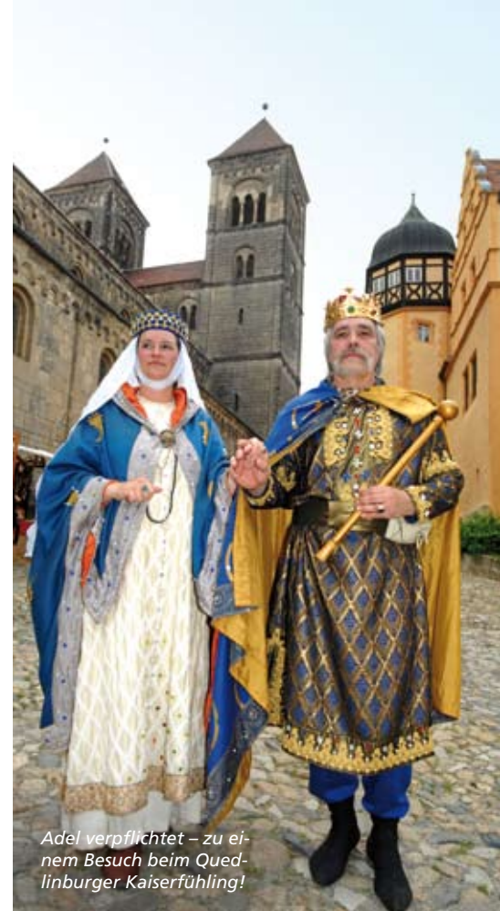
Adel verpflichtet – zu einem Besuch beim Quedlinburger Kaiserföhling!