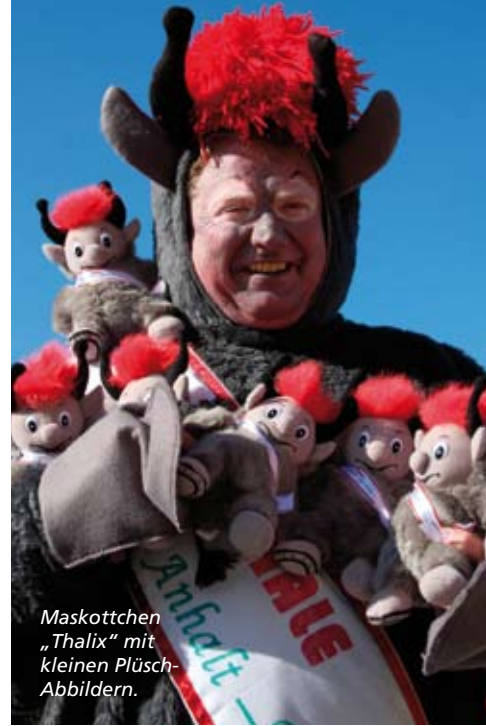
Maskottchen „Thalix“ mit kleinen Plüsch-Abbildern.