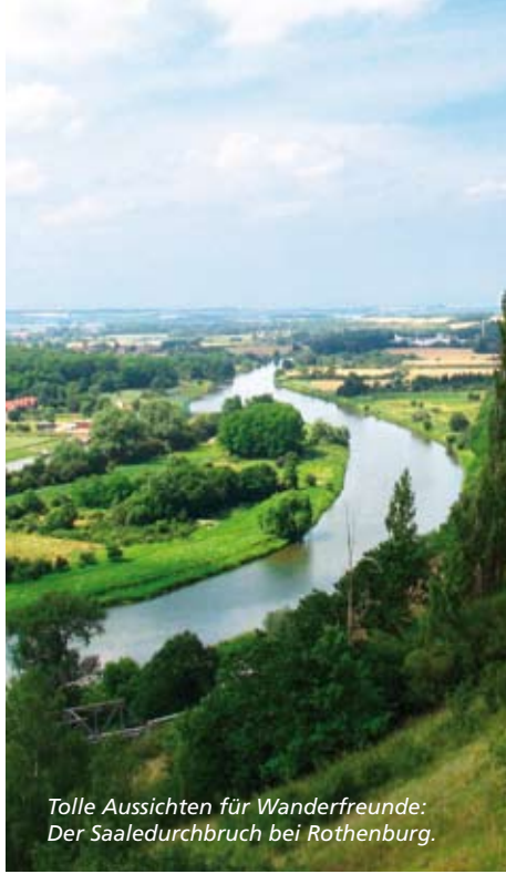
Tolle Aussichten für Wanderfreunde: Der Saaledurchbruch bei Rothenburg.