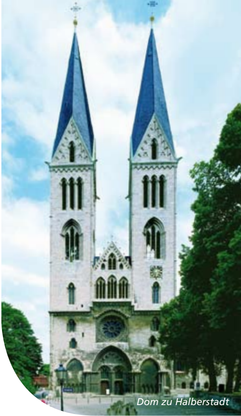
Dom zu Halberstadt