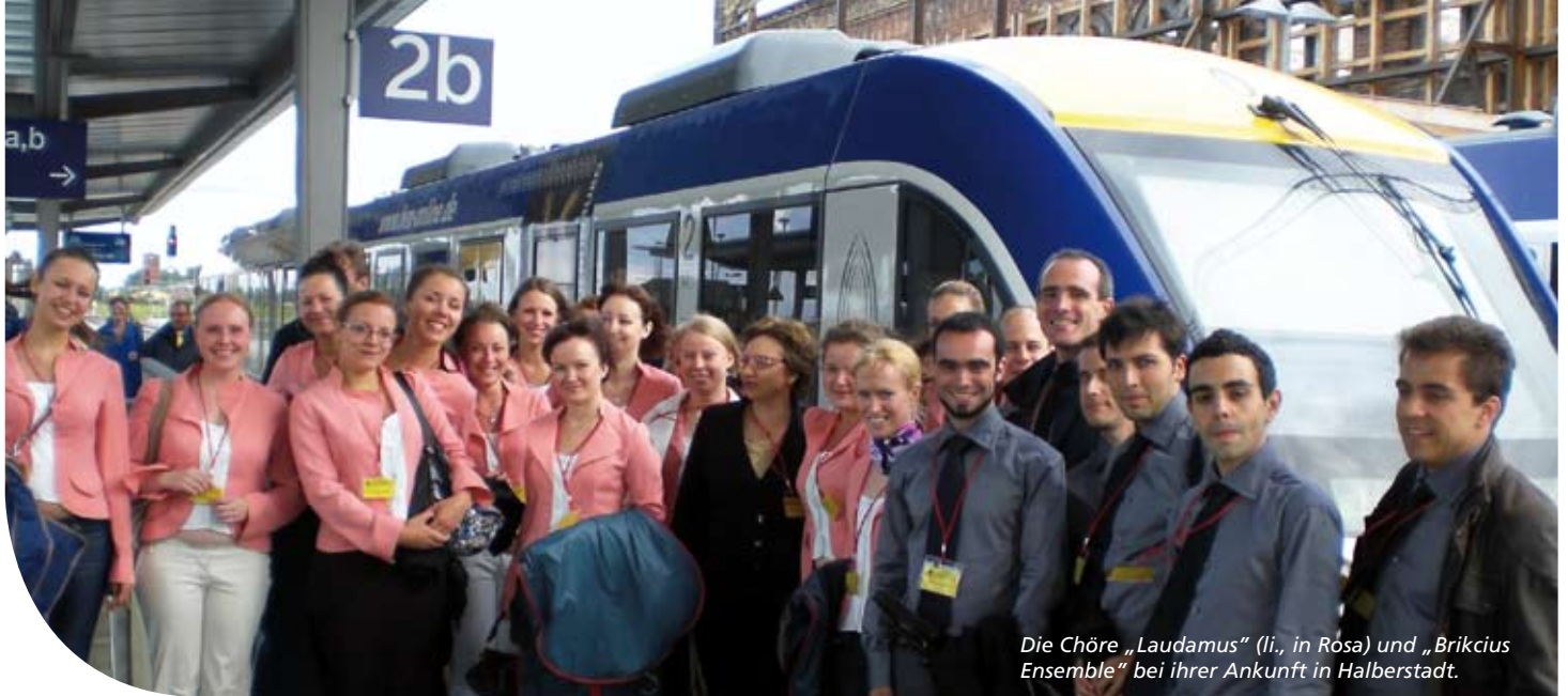
Die Chöre „Laudamus“ (li., in Rosa) und „Brikcius Ensemble“ bei ihrer Ankunft in Halberstadt.