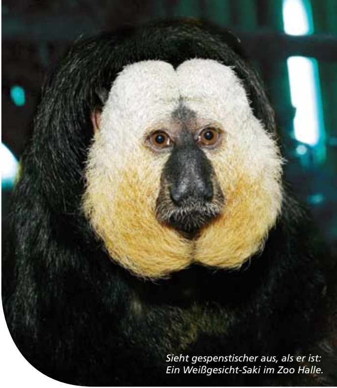
Sieht gespenstischer aus, als er ist: Ein Weißgesicht-Saki im Zoo Halle.