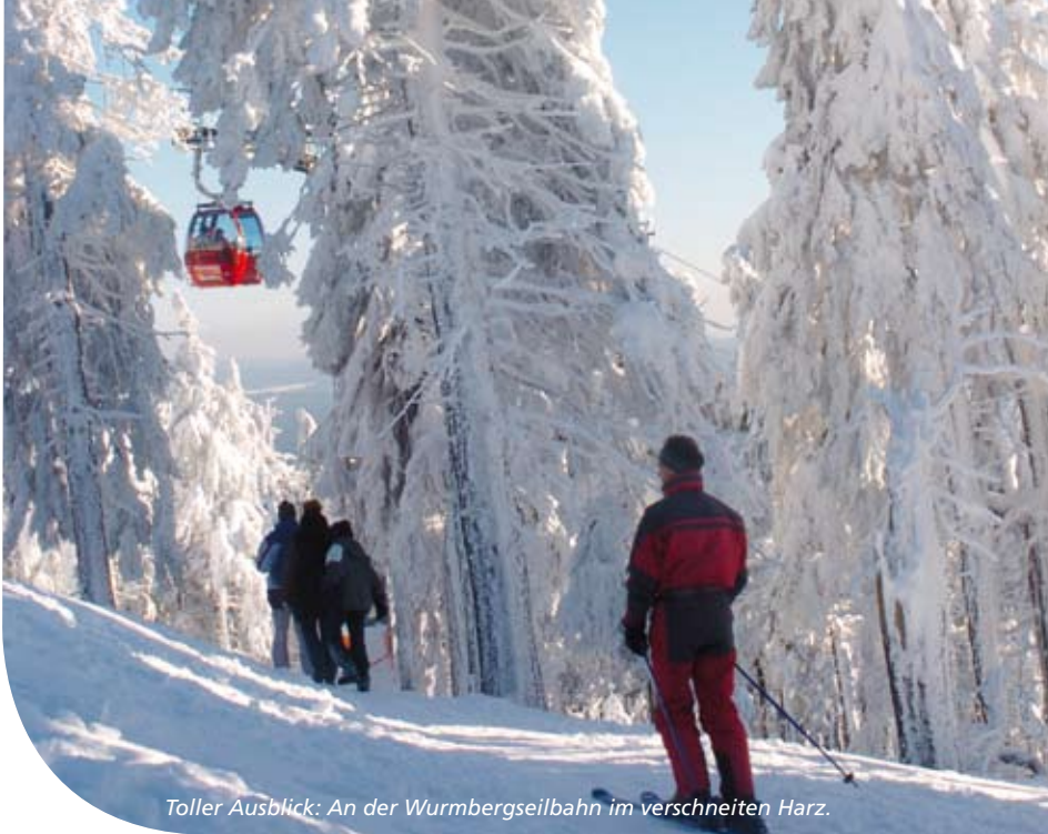
Toller Ausblick: An der Wurmbergseilbahn im verschneiten Harz.