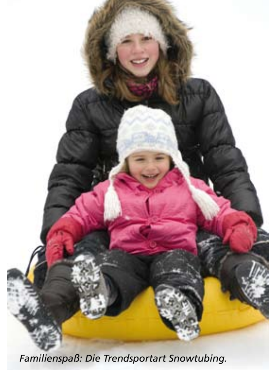
Familienspaß: Die Trendsportart Snowtubing.