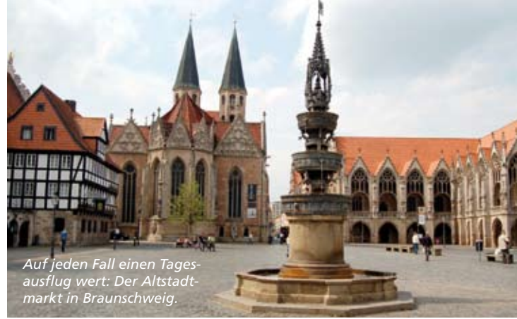
Auf jeden Fall einen Tagesausflug wert: Der Altstadtmarkt in Braunschweig.