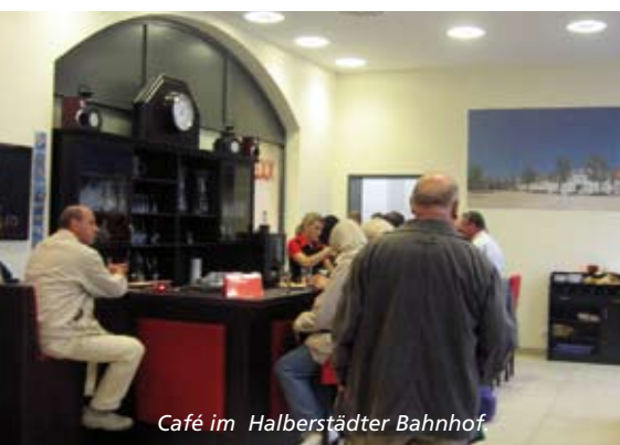
Café im Halberstädter Bahnhof

Für Kinder ist Zugfahren meist ein großer Spaß: draußen gibt es allerhand zu sehen und drinnen kann man sich mit Mama, Papa und den Geschwistern die Zeit vertreiben. Vieles ist für die Kleinen aber auch neu und wirft Fragen auf, zum Beispiel: Was bedeuten die Hinweisschilder und Signale am Bahnhof? Was tun, wenn die Zugtür zu schnell schließt? Und wer hilft unterwegs bei Problemen? All diese Fragen möchte der HEX seinen jungen Fahrgästen in einem Kindersicherheitstraining beantworten – und sie so fürs Bahnreisen fit machen. In Zusammenarbeit mit der Bundespolizei laden wir im Oktober und November Schulklassen verschiedener Altersstufen zu zwei Veranstaltungen in Halberstadt und Halle (Saale) ein. Für 2011 sind weitere Termine in Magdeburg, Halberstadt und Halle (Saale) geplant. Jeweils einen Tag lang erläutern wir den Kindern spielerisch das Verhalten am Bahnsteig, auf dem Bahnhof und im Zug. Es werden Kenntnisse zu den Schrankenanlagen, zur Zugtechnik und zum Zugbetrieb vermittelt – unter anderem bei der Besichtigung eines HEX-Zuges. Außerdem werden die Schüler durch Rollenspiele und praktische Anwendungen spielerisch mit dem Bahnverkehr vertraut gemacht und im Umgang mit Gefahrensituationen geschult. Das Sicherheitstraining ist für die Kinder kostenlos.