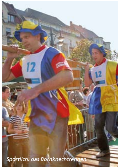
Sportlich: das Bornknechtrennen.