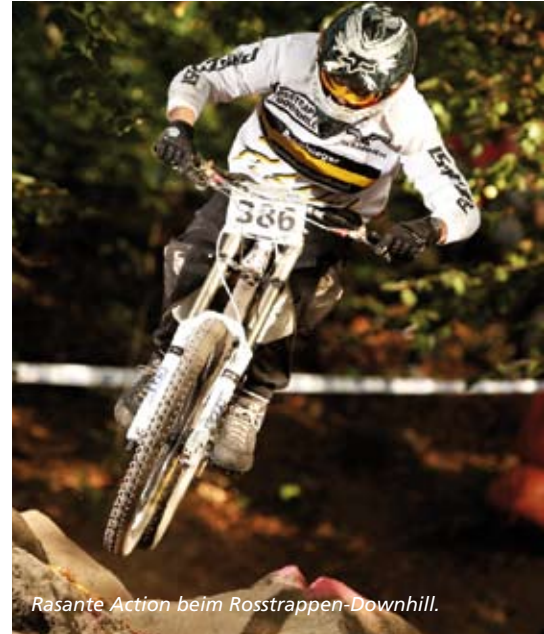
Rasante Action beim Rosstrappen-Downhill.