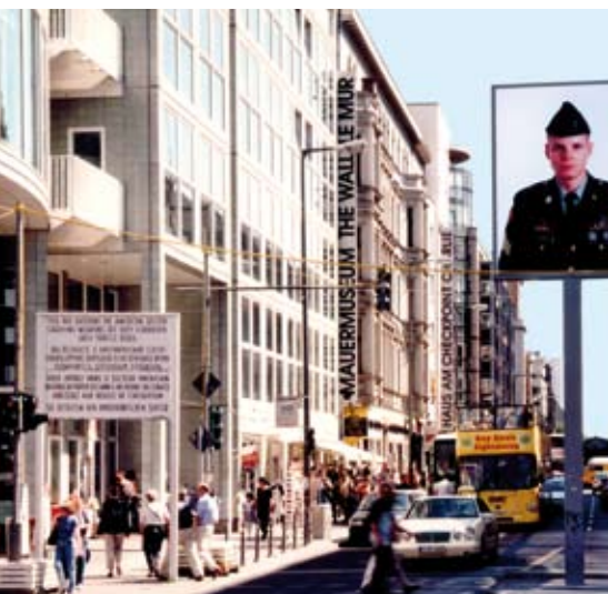
Am Checkpoint Charlie in Berlin wird die Vergangenheit lebendig.

tieren und während der Zugfahrt lohnenswerte Ausflugstipps erhalten. Neben Repräsentanten der Stadt Thale werden dann auch Botschafter der Seilbahnen Thale, der im März 2011 eröffnenden Bodetal Therme, des Harzer Bergtheaters und des Bau-Spiel-Hauses die Zugfahrt ab Berlin und im HEX-Streckennetz beleben. Der HarzElbeExpress wird somit für Sie zum wandelnden Veranstaltungskalender. Vertieft wird die Partnerschaft im Harz auch mit einer Zugtaufe im Herbst, zu der alle Interessierten herzlich eingeladen sind.