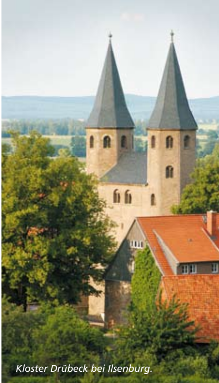
Kloster Drübeck bei Ilsenburg.