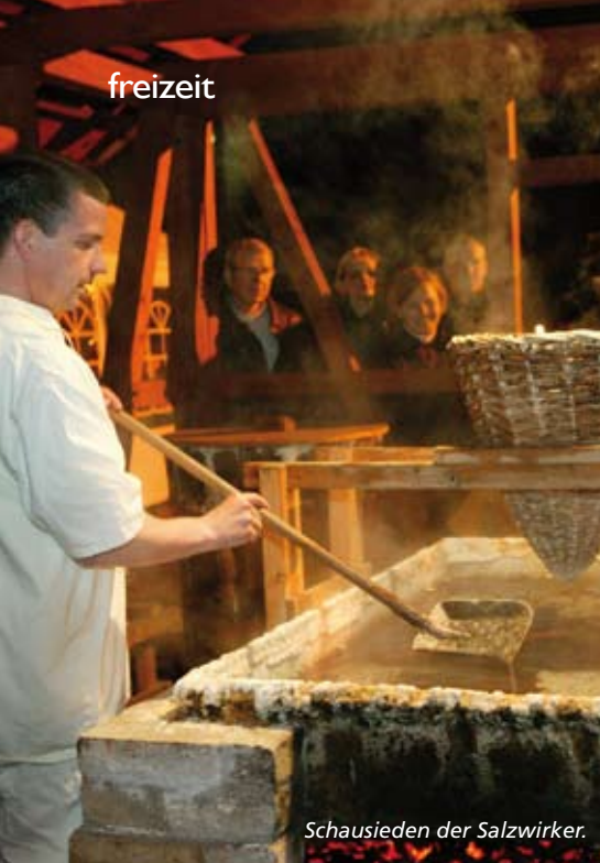
Schausieden der Salzwirker.