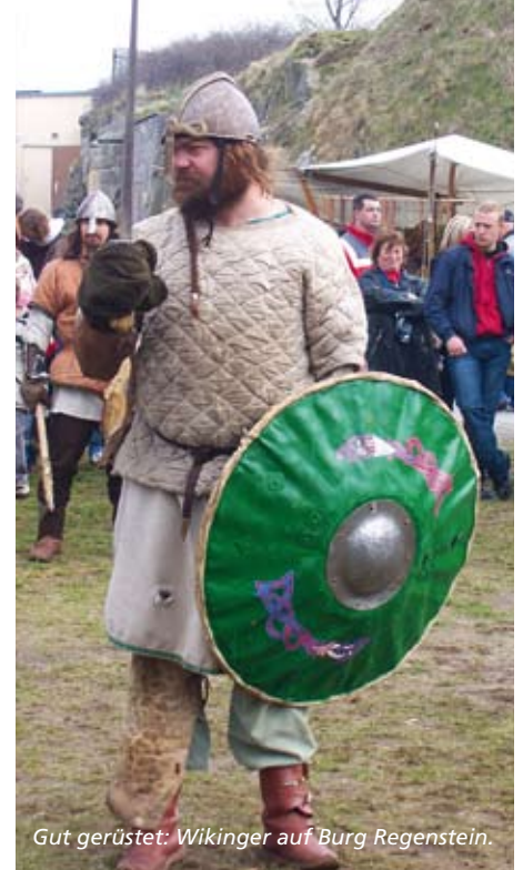
Gut gerüstet: Wikinger auf Burg Regenstein.