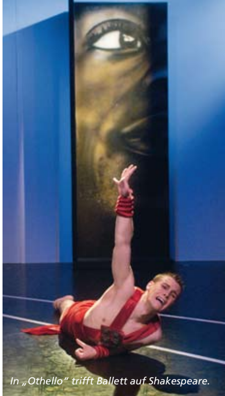
In „Othello“ trifft Ballett auf Shakespeare.