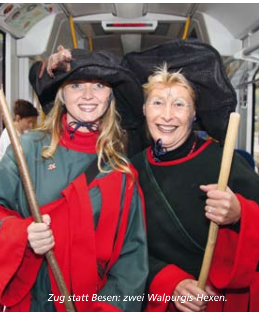
Zug statt Besen: zwei Walpurgis-Hexen.