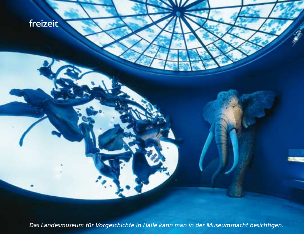
Das Landesmuseum für Vorgeschichte in Halle kann man in der Museumsnacht besichtigen.